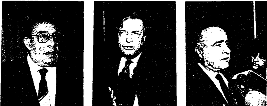
السفير الاسباني مع السيد جان عبيد

عرضت مع دولة العماد عون المواضيع الطروحة على الساحة في صورة اجمالية، وتداولنا فيها وفي المنطلقات التي تساعد دائما على حل الازمة اللبنانية، للخروج من المأزق الذي نحن فيه. فمن وقت الى آخر من الضروري ان نتشبع الى وجهات النظر لكي نستطيع معالجة الاوضاع بشكل روية وحكمة. ابو سليمان استقبل العماد عون في الاولي المجلس التنفيذي للرابطة المرونية برئاسة المحامي شكر ابو سليمان. استمرت الزيارة ساعة تقريبا في المحامي ابو سليمان كانت جولة اوفى بالموضوع والطرح على الساحة اللبنانية ووضعها في اجندات الكويت والوضع الاقتصادي في لبنان، وكما مرلتح الى الشرح الذي ابداه دولة الرئيس الحسيني لتثبيت الشرعية وللشروط التي تقدمها الى لجنة المساعي الحميدة العربية في تونس. وللوضع الاقتصادي الذي يتحضر تدريجيا خصوصا بعدما استقرت الأوضاع في لبنان وعلى المراقب العام. سئل هل ستكثرون الدعوة الى الكويت في حال دعيت؟ فاجب: لم تصل بعد دعوات احد. ولكن لا يبعد ان يكون الامم المتحدة في لبنان، والاقوات اللبنانية، والاقوات العربية، وما هي الطروحات هناك. هذا هو السبق على الوجهة الايجابية في الكويت. وقد هناك العماد عون على هذا الموضوع وتتمنى على السيد جان عبيد ان لا يبعثوا بالموقف الصحيح والواضح والواضح الذي وقفه العماد عون، والذي حاز اعجاب جميع العرب.